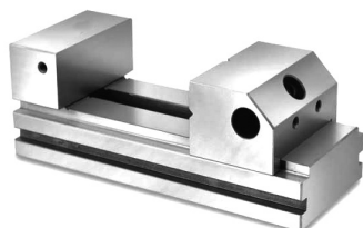
Abbildung 2 / Obr. 2