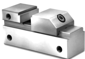
Abbildung 1 / Obr. 1